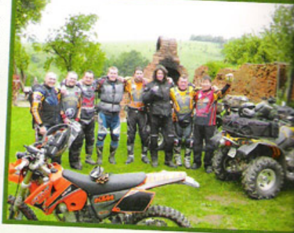
Text: Tomáš Krížek